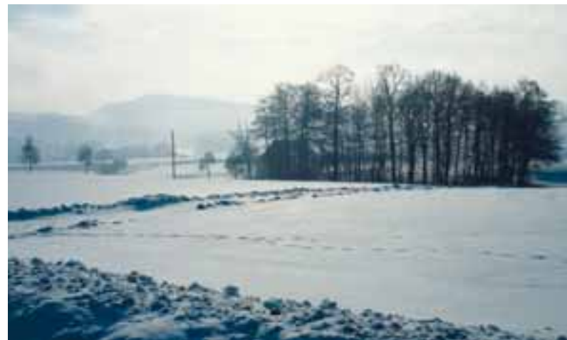
So schön kann der Winter sein – geheizt werden muss trotzdem.

Feuerwerkskörper und Raketen sollte man seitwärts stehend