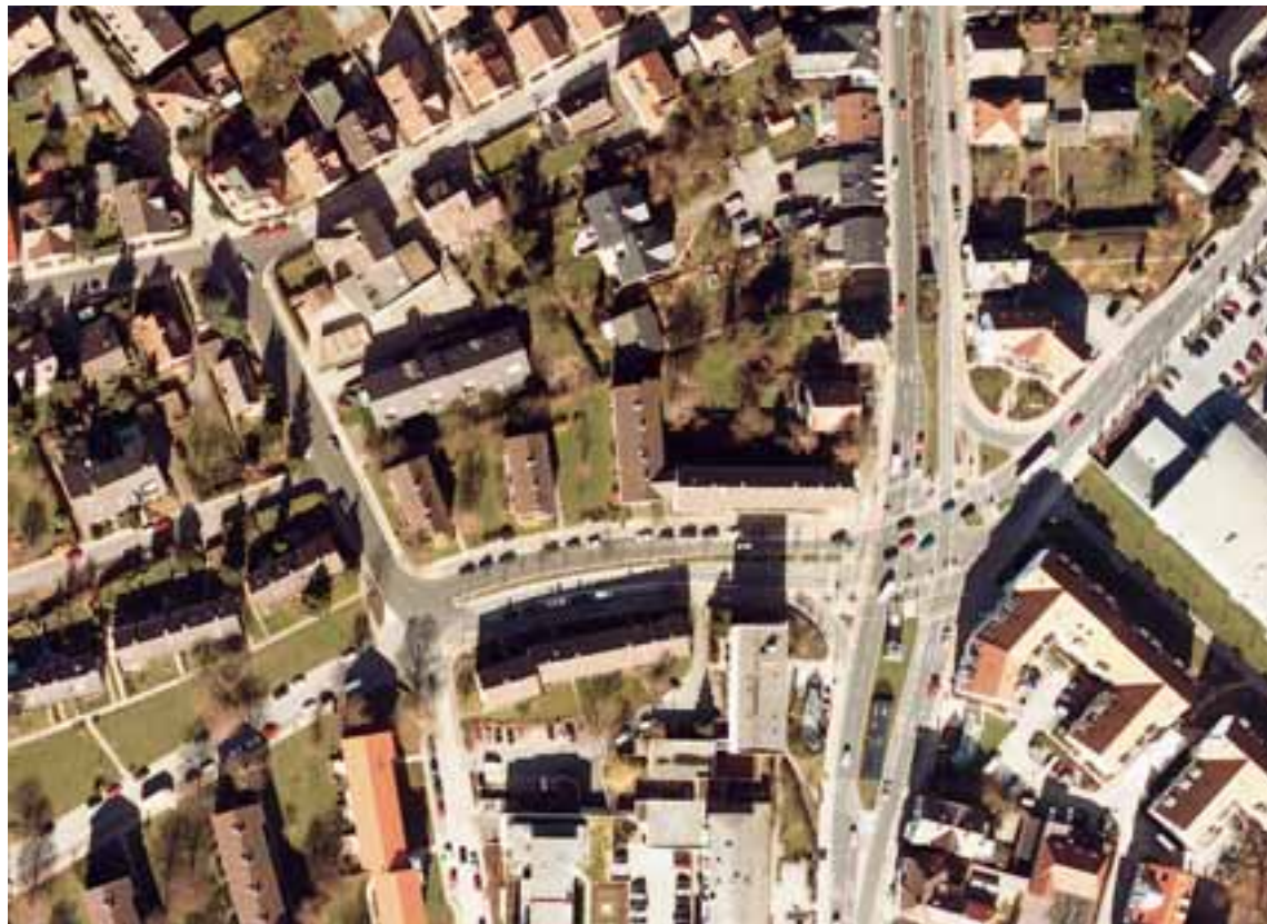
Die Luftaufnahme zeigt das künftige Baugebiet des Nachbarschaftszentrums in der Bildmitte.