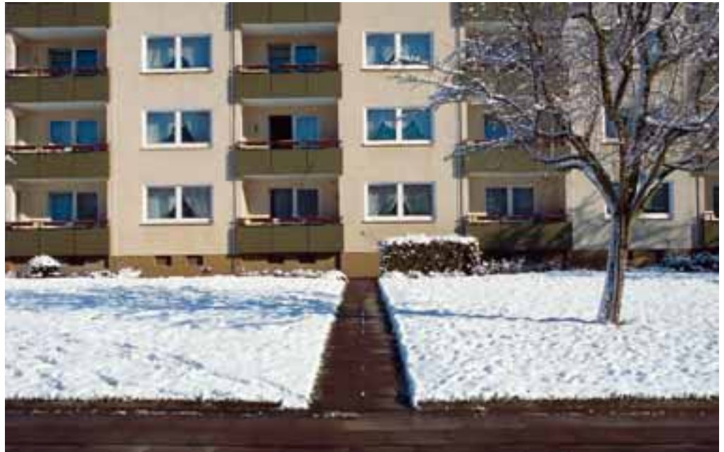
So sieht vorbildliche Schneeräumung aus: hier an der Siebenbürger Straße

W enn die Haus-Service-Gesellschaft von den Mitgliedern der Genossenschaft mit der Schneeräumung beauftragt ist, dann will sie ihre Aufgabe natürlich möglichst umgehend und zur Zufriedenheit der Mitglieder der Freien Scholle erledigen. Das kann allerdings dann problema-