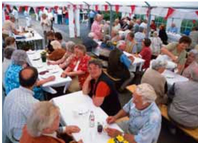
Solche Feste wären ohne engagierte Mithilfe der Mitglieder nicht möglich.

E ine Aufgabe des Freie Scholle Nachbarschaftshilfevereins ist es, die Gemeinschaft im Stadtteil zu fördern und zu stärken. Hierzu unterhält er in jedem Siedlungsgebiet der Genossenschaft einen Nachbarschaftstreff, der den Mitgliedern für ihre selbst organisierten Aktivitäten offen steht. Je nach den Ideen und Interessen