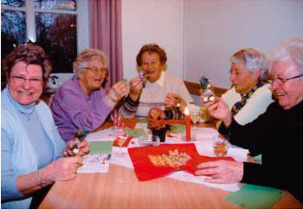
Weihnachten kann kommen: gute Stimmung bei der Weihnachtfeier im Adolf-Damaschke-Heim