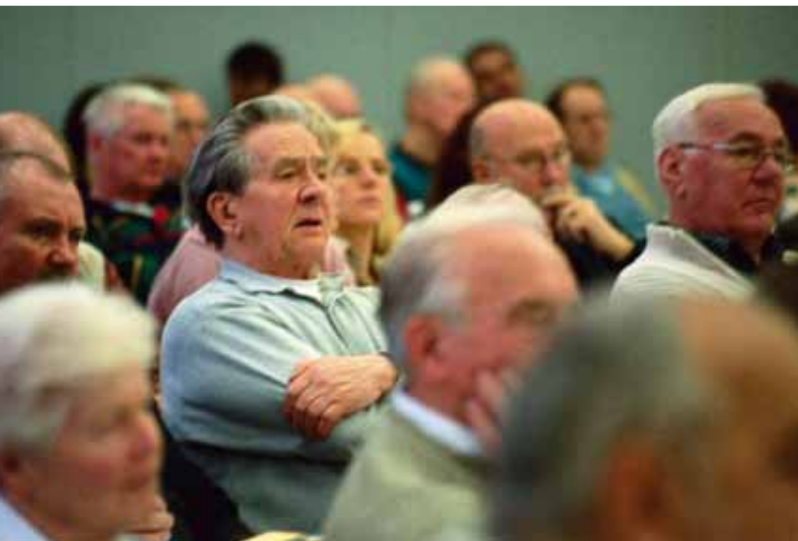
Wohnen in der Zukunft: interessante Neuigkeiten für ein konzentriertes Publikum