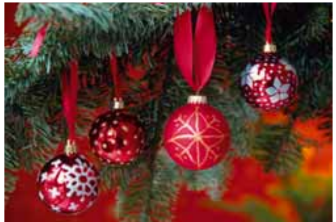
So schön können alte Kugeln im neuen Glanz erstrahlen.

Punkten und selbst erdachten Mustern. Immer ein kleines Stück, trocknen lassen und weitermalen. Die Farbe muss über