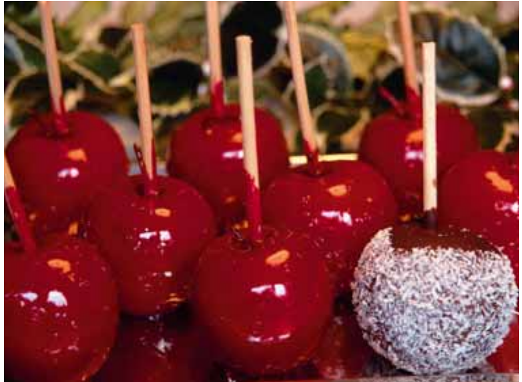
Zu Weihnachten sind Liebesäpfel eine schöne Leckerei – das Rezept hat Schollinchen auf Seite 14.

Indem sie beispielsweise unseren Nachbarschaftshilfeverein unterstützen und selbst verschiedenste nachbarschaftliche Aktivitäten organisieren, tragen sie entscheidend zum guten Wohnen in ihren Siedlungen bei. Gleichzeitig ist diese Selbsthilfeleistung die Voraussetzung dafür, dass die Freie Scholle ihr Angebot an sozialen Dienstleistungen ohne Einschränkungen weiter führen kann, während an anderen Stellen in unserer Stadt