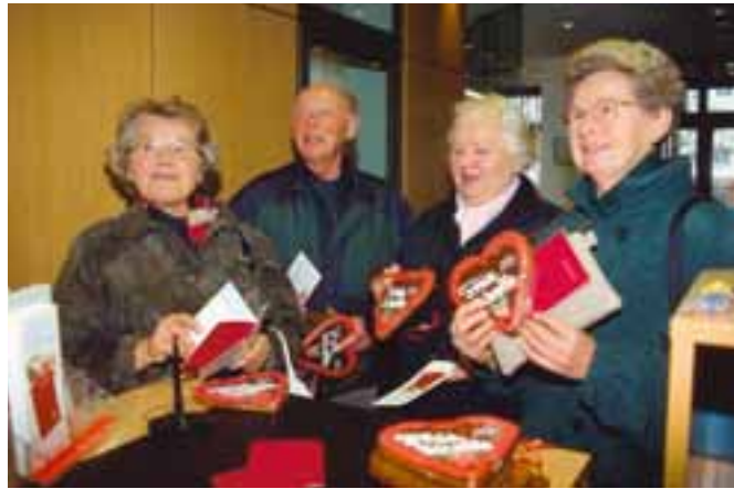
Sparen mit Herz: Was dem Sparer nützt, nützt auch der Scholle.

Auf das besondere Interesse der Sparer stieß der Scholle-Sparbrief. Allerdings hängt das Ausgabevolumen der Sparbriefe von der Höhe des Einlagenbestandes der Spareinrichtung ab. Auf Grund der starken Nachfrage war das Kontingent deshalb bereits am ersten Tag ausgeschöpft. Dabei hatten