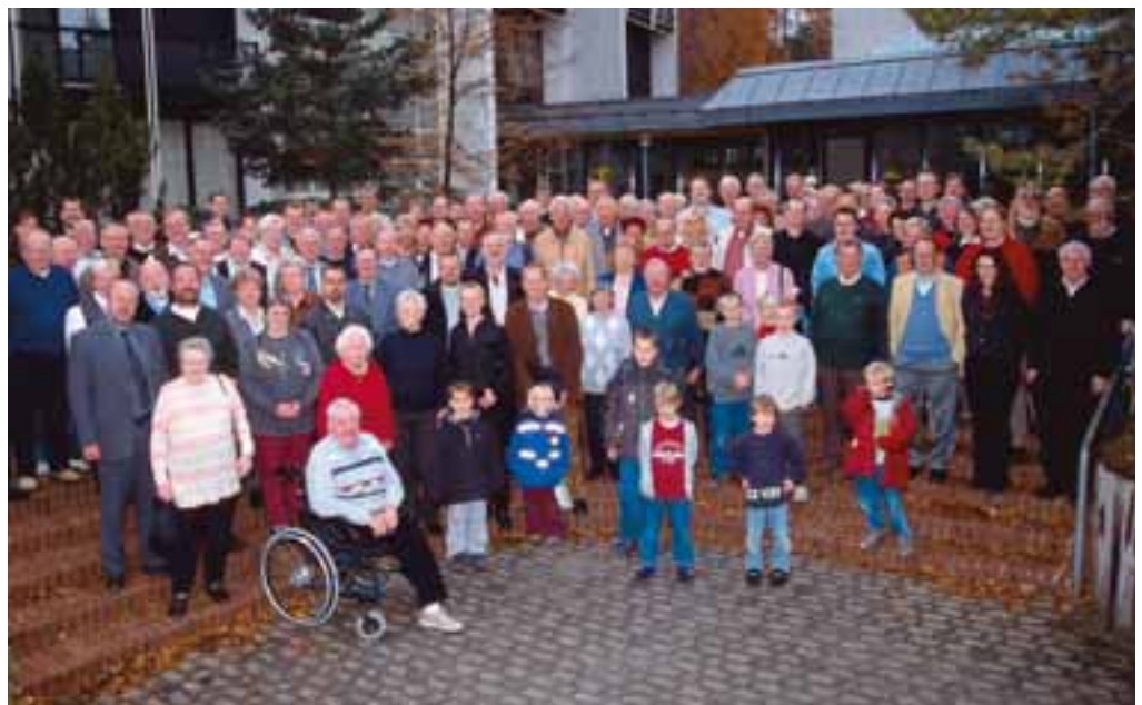
Die über hundert Teilnehmer der Vertreterkonferenz 2003 in Haus Neuland