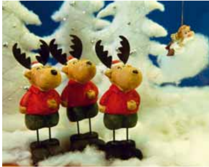
Visionen? Wer weiß, auch Elche haben welche.

Überlegen Se mal: Was ham wir nich alles inne Horoskope gelesen! Und was ham wir nich alles geglaubt! Aber was is am Ende geworden? Bei mir stand zum Beispiel: »Sportliche Betätigung im Mai führt zum Erfolg!« Ja, da hätt ich doch im Traum nich gedacht, dass wir diese Saison Erzgebirge Aue auffem Sportplatz beim Balltreten zu-kucken müssen!