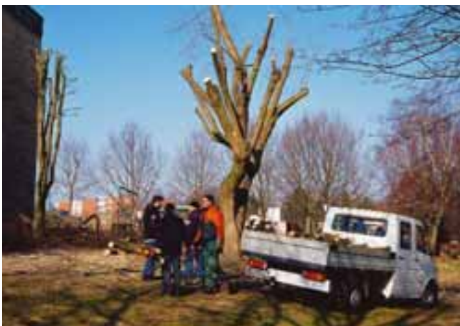
Neben Reinigungsarbeiten übernimmt die Haus-Service-GmbH auch die Pflege der Grünanlagen in den Siedlungen der Freien Scholle.

Wer sich gegen Glasbruch in der Wohnung versichern will, sollte deshalb zusätzlich eine Glasbruchversicherung abschließen. Damit sind nicht nur Schäden in der Wohnung, sondern auch am eigenen Hausrat wie am Ceran-Kochfeld oder einem Bilderrahmen mit versichert. Durch die Hausratversicherung sind diese Schäden nämlich nicht abgedeckt.