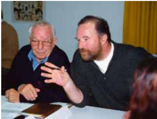
Engagierte Diskussionen in den fünf Arbeitsgruppen der Vertreterkonferenz

lungen erhalten bleiben. Voraussetzung für die Verwirklichung aller vorgeschlagenen Maßnahmen sei aber, dass sie in Einklang mit den wirtschaftlichen Möglichkeiten der Freien Scholle stehen.