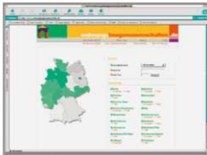
Die Angebote von 230 Wohnungsbaugenossenschaften auf einen Klick

Darüber hinaus bieten die Genossenschaften ihre freien Wohnungen in einer gemeinsamen Wohnungsbörse an. Bereits jetzt verfügen die Genossenschaften in Niedersachsen, Hamburg, Berlin und Bielefeld über gemeinsame Wohnungssuchprogramme. In Kürze fertig gestellt ist eine gemeinsame Wohnungsbörse aller Genossenschaften des Verbundes. Sie soll im Frühjahr 2004 im Netz zugänglich sein. Dann genügt es, seinen Wohnungswunsch und den Namen der Stadt einzugeben, um eine Übersicht über die dort freien Genossenschaftswohnungen zu erhalten.