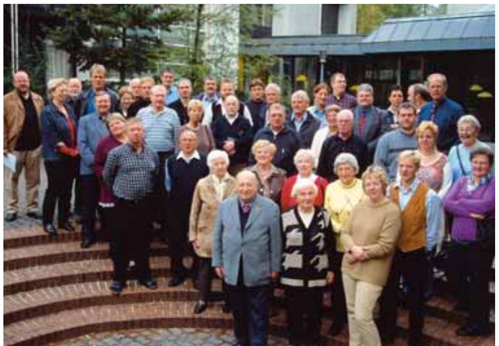
Die Teilnehmer des zweiten Mitgliederseminars Spindelstraße im Oktober 2003 in Haus Neuland