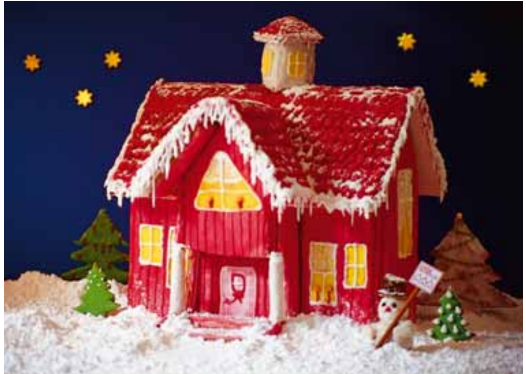
Nicht nur Schneemänner wissen, wo man gut wohnt.

Dass das Wohnen in der Freien Scholle darüber hinaus auch gutes Wohnen in guter Nachbarschaft bedeutet, haben die zahlreichen Feiern und Feste gezeigt, die die Mitglieder mit großem Einsatz selbst organisiert haben. Auf den Punkt gebracht haben das die Macher des Siedlungsfestes Dürerstraße, die unter dem Titel »Wohlfühl-Wohnen« die Ausstellung »25 Jahre Siedlungsgebiet Dürerstraße« gestalteten.