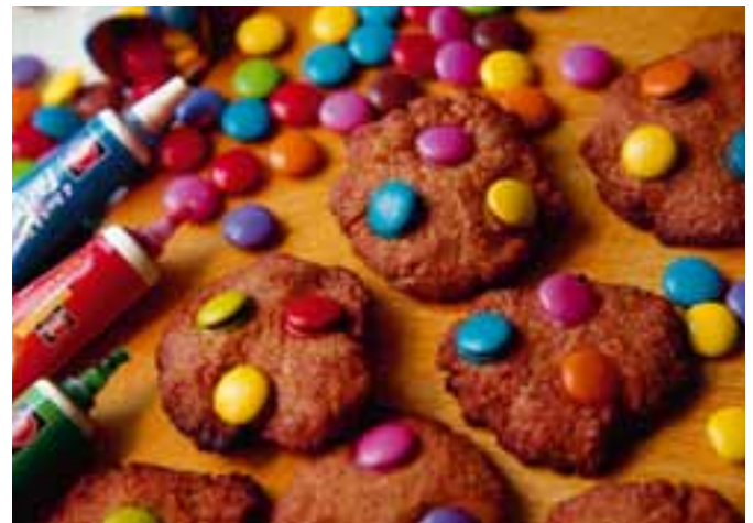
Bunt und schmackhaft: Zimtplätzchen nach Schollinchen-Art

2. Mehl mit Zimt und Backpulver mischen, die Mischung schön langsam unter die Zucker-Butter-Masse rühren. Mit dem Teelöffel kleine Häufchen