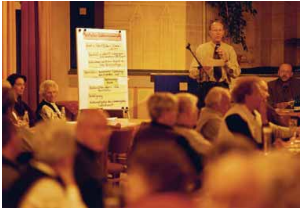
Wie wählen, warum wählen, wann wählen: Alles wurde im Vorfeld erklärt.

Sehr gut verlaufen sind die Vertreterwahlen der Freien Scholle, die zwischen dem 25. September und dem 31. Oktober in elf Wahlbezirken stattfanden. Die Voraussetzung dazu hatten die Vertreter mit der Reform der Vertreterwahlen geschaffen. Eine deutlich höhere Wahlbeteiligung sowie mehr Raum für Diskussionen über die Situation in den Siedlungen bestimmten die Wahlversammlungen.