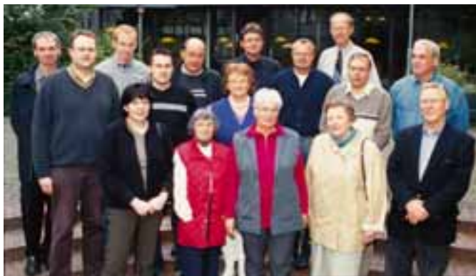
Die Haus sprecher des Siedlungsgebietes Im Siekerfelde

C hancen und Möglichkeiten eines Haus sprechers erörterten die 13 Teilnehmer des Haus sprecherseminars Im Siekerfelde am 28. September in Haus Neuland. An Fallbeispielen erörterten sie die Handlungsmöglichkeiten, die ihnen das Amt bietet.