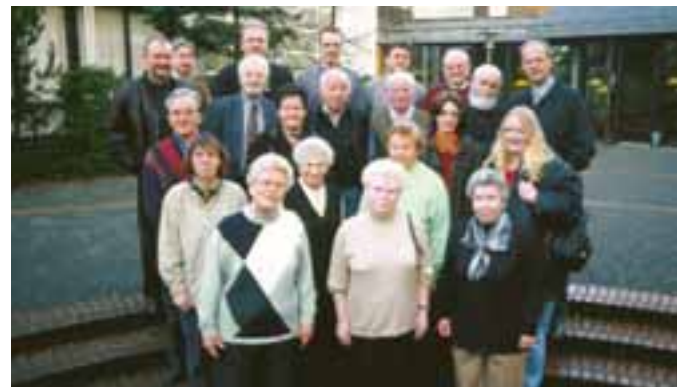
Die Haus sprecher des Siedlungsgebietes Heeper Fichten

A m 23. November fand in Haus Neuland das erste von insgesamt zwei Haus sprecherseminaren für das Siedlungsgebiet Heeper Fichten statt.