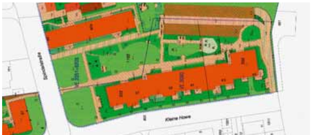
Von der Luftaufnahme zur Karte: Jeder Baum, jeder Strauch ist erfasst – hier an der Kleinen Howe.