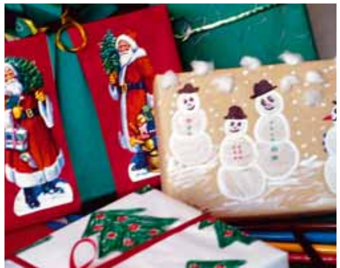
Da kann so manches gekaufte Geschenkpapier einpacken.

Ihr braucht Packpapier, Seidenpapier in verschiedenen Farben, Watte, Kleber, Filz- oder Buntstifte und etwas Geduld. Breitet das Papier auf einem Tisch aus und bemalt es nun mit weihnachtlichen Motiven. Fangt oben links an zu zeichnen, z.B. einen Stern. Etwas Abstand lassen und den nächsten Stern daneben malen, dann darunter und so weiter. So schmückt Ihr Eure Bögen mit Tannenzwei-