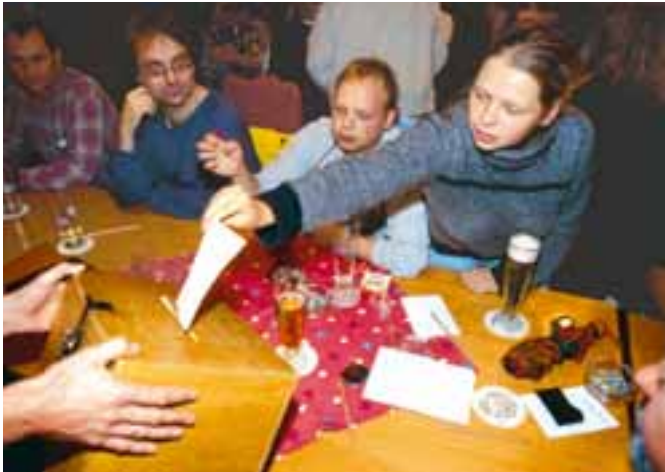
Abgestimmt: Jede Stimme zählt für das Wahlergebnis.