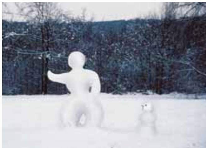
Ich hab's genau gesehen: Der Schneemann hat geworfen.

Mit nem bisschen Schnee hatten wir eben grade unsern Schneemann fertig gestellt, und mein Enkel war auch stolz wie Oskar. – Oppa übrigens auch.