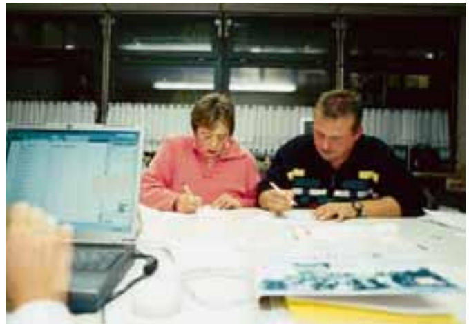
Ausgezählt: Alle abgegebenen Stimmen werden sorgfältig erfasst.