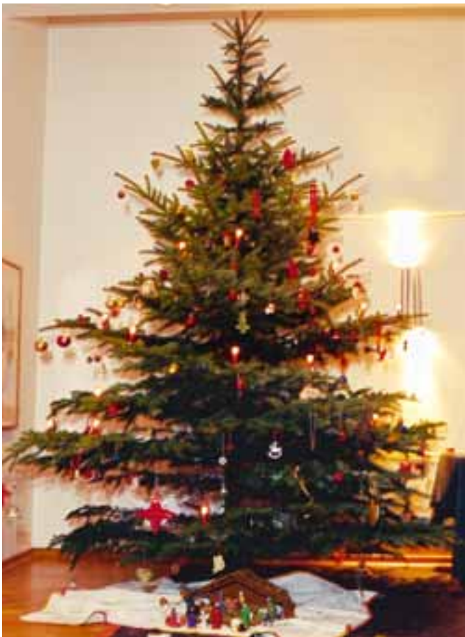
Wenn wir vom brennenden Weihnachtsbaum sprechen, meinen wir glücklicherweise meistens die Kerzen.