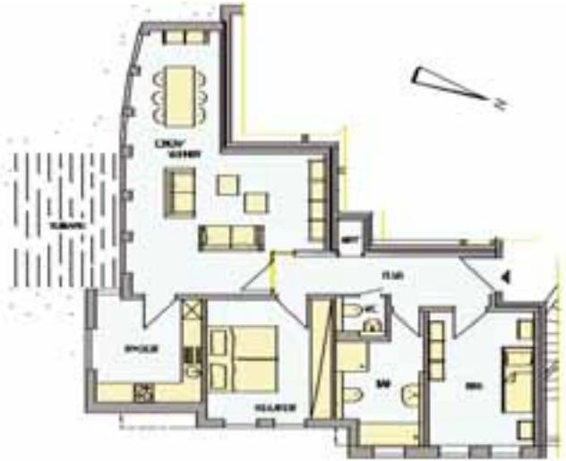
Großzügig und hell: Grundriss einer Drei-Zimmer-Wohnung

A nfang nächsten Jahres beginnen die Arbeiten für den Abriss und anschließenden Neubau des Hauses Albert-Schweitzer-Straße 15 / 15 a. In Absprache mit den betroffenen Mitgliedern baut die Freie Scholle für rund 2,8 Millionen € 25 barrierefreie Geschoss- und Maisonette-Wohnungen. Sie ergänzen den Wohnungsbestand der Siedlung so, dass die Voraussetzungen für lebensgerechtes Wohnen nachhaltig verbessert werden.