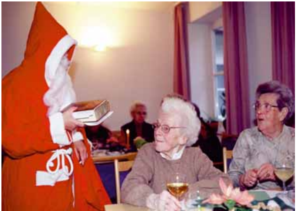
Der Nikolaus ist da: Weihnachtsfeier im Adolf-Damaschke-Heim