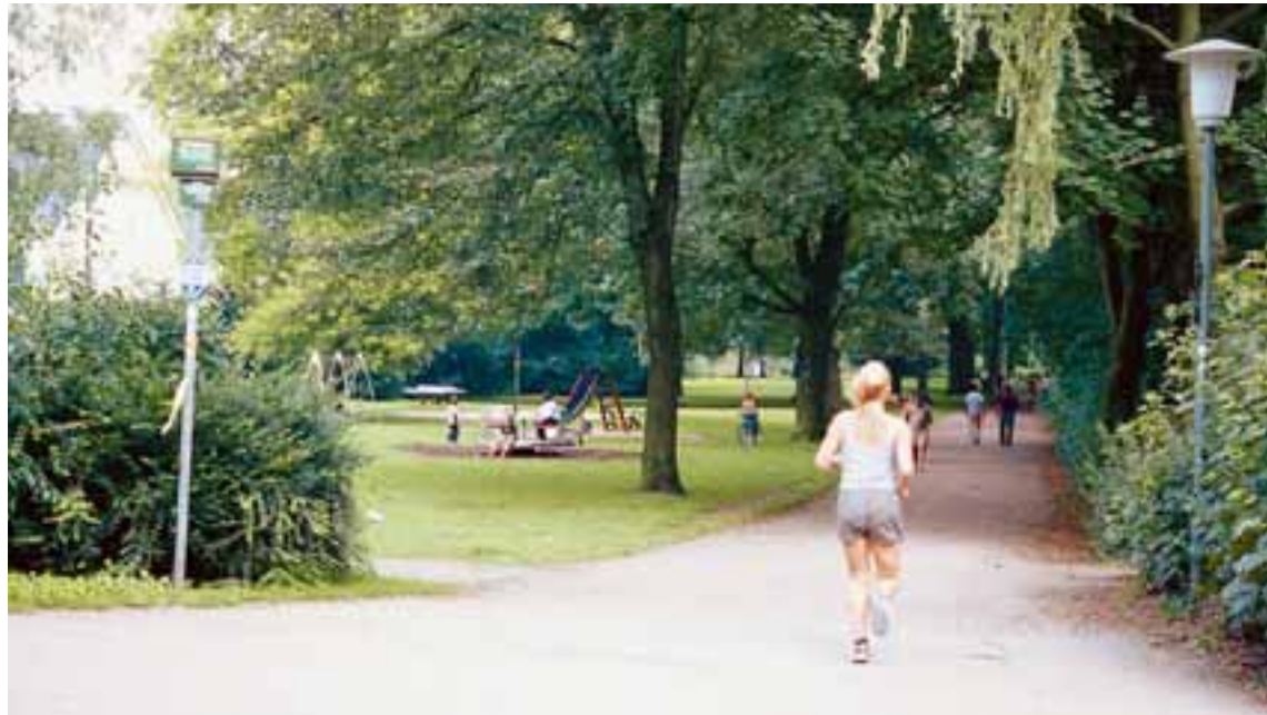
Eine bedrohte Idylle: Die neue B 66 würde den Grünzug an der Rußheide erheblich beeinträchtigen.

Für rund 90 Millionen € will die Stadt Bielefeld die B66 neu vom Ausgang des Ostwestfalen-Tunnels bis zum Autobahnanschluss in Hillegossen bauen. Über die 6,18 km lange Trasse, die entlang der Bahnlinie nach Lippe durch den Grünzug im Bielefelder Osten verlaufen soll, würden täglich 36.000 bis 48.000 Fahrzeuge fahren. Notwendig, um andere Straßen zu entlasten, sagen die Planer. Eine Verkehrsplanung aus den 60er Jahren, durch die sich die Wohnqualität im Bielefelder Osten erheblich verschlechtern würde, sagen die Gegner.