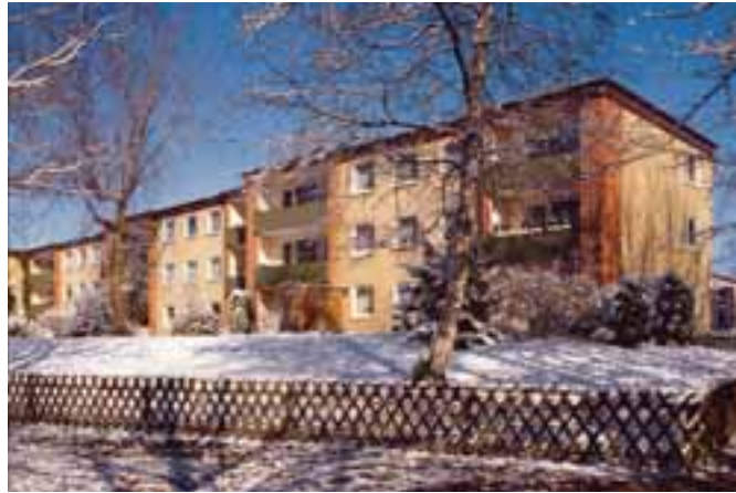
Haben auch im Winter ihren Reiz: Bäume in der Siebenbürger Straße

Um den zu verhindern, hat die Technische Abteilung einen Ablaufplan entwickelt, der das Fäl-