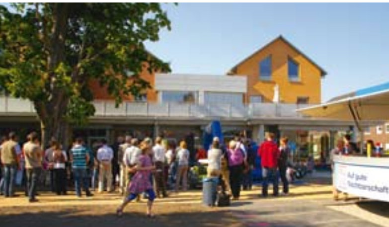
Ein Grund zum Feiern: die Eröffnung vom »Brot+Zeit«

Am 25. Mai eröffnete die von Laer Stiftung das »Brot+Zeit«. Der Stadtteiltreff ist ein weiterer Baustein des Modellprojekts »Mühlenpark«. Damit wollen die von Laer Stiftung und die Freie Scholle das Zusammenleben der Generationen im Quartier fördern.