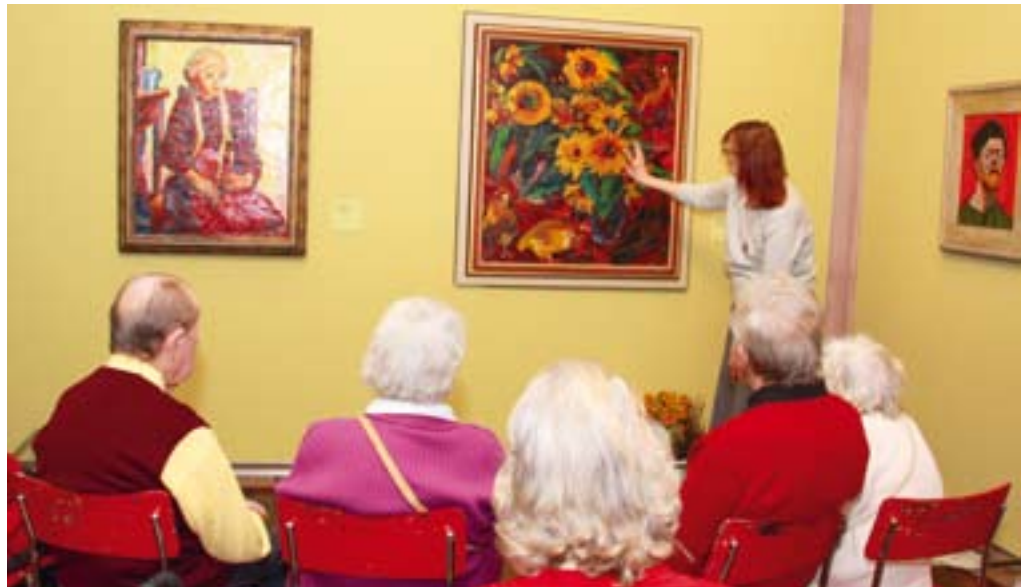
Museumsbesuch mit Demenzkranken in der Bielefelder Kunsthalle