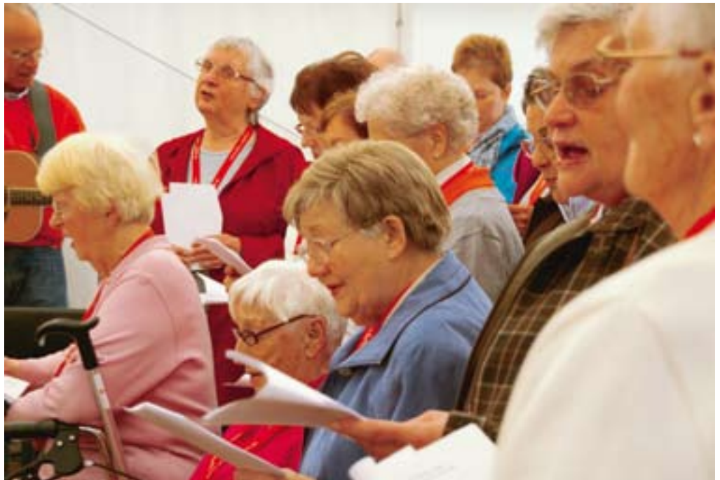
Aktiv im Alter: Die Scholle-Krähen vom Langen Kampe singen beim Tag der offenen Tür.

lare gelten die Mitglieder, die zwar der Genossenschaft seit 50 Jahre angehören, aber in dieser Zeit gar nicht oder nur vorübergehend in einer eigenen Wohnung in der Freien Scholle