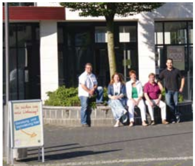
Das Vermietungsteam vor der neuen Filiale am Reichowplatz 11

An beiden Standorten hängen die aktuellen Wohnungsangebote des jeweiligen Siedlungsgebietes aus.