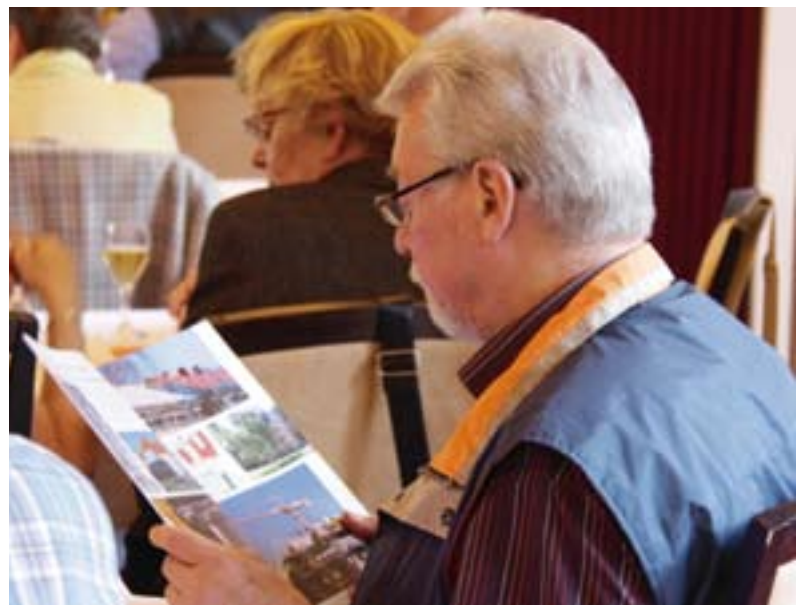
Im Geschäftsbericht finden die Vertreter alle wichtigen Informationen.