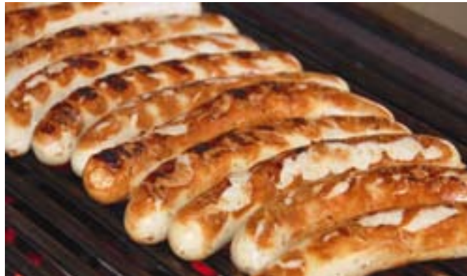
Diese Freunde kommen auch am 10. September

len, weil das ja viel praktischer is, als jeden einzeln anzurufen, dann passen Se bloß auf, dass Se den Haken da machen, wo er hingehört. Sonst erfahren nich nur Ihre Kumpels, dass Se Geburtstag feiern, sondern die ganze Facebook-Gemeinde – und das sollen inzwischen in Deutschland 18 Millionen sein.