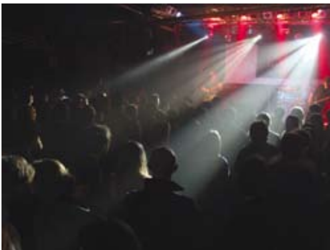
Rockten das »Forum«: Funky Fish & the SKAngaroos (oben) und Mollycoddle Monkeywrenches