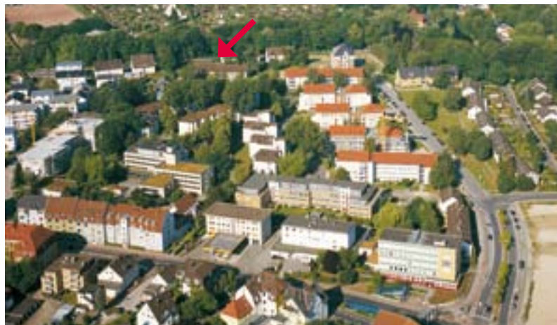
Hier (siehe Pfeil) kommen Autos jetzt nicht mehr weiter.

Im Februar 2002 stimmte die Ratsfraktion von SPD, Grünen und die BfB gegen den Durchbau. Wenig später konnte die Genossenschaft die Albert-Schweitzer-Straße von der Stadt Bielefeld erwerben.