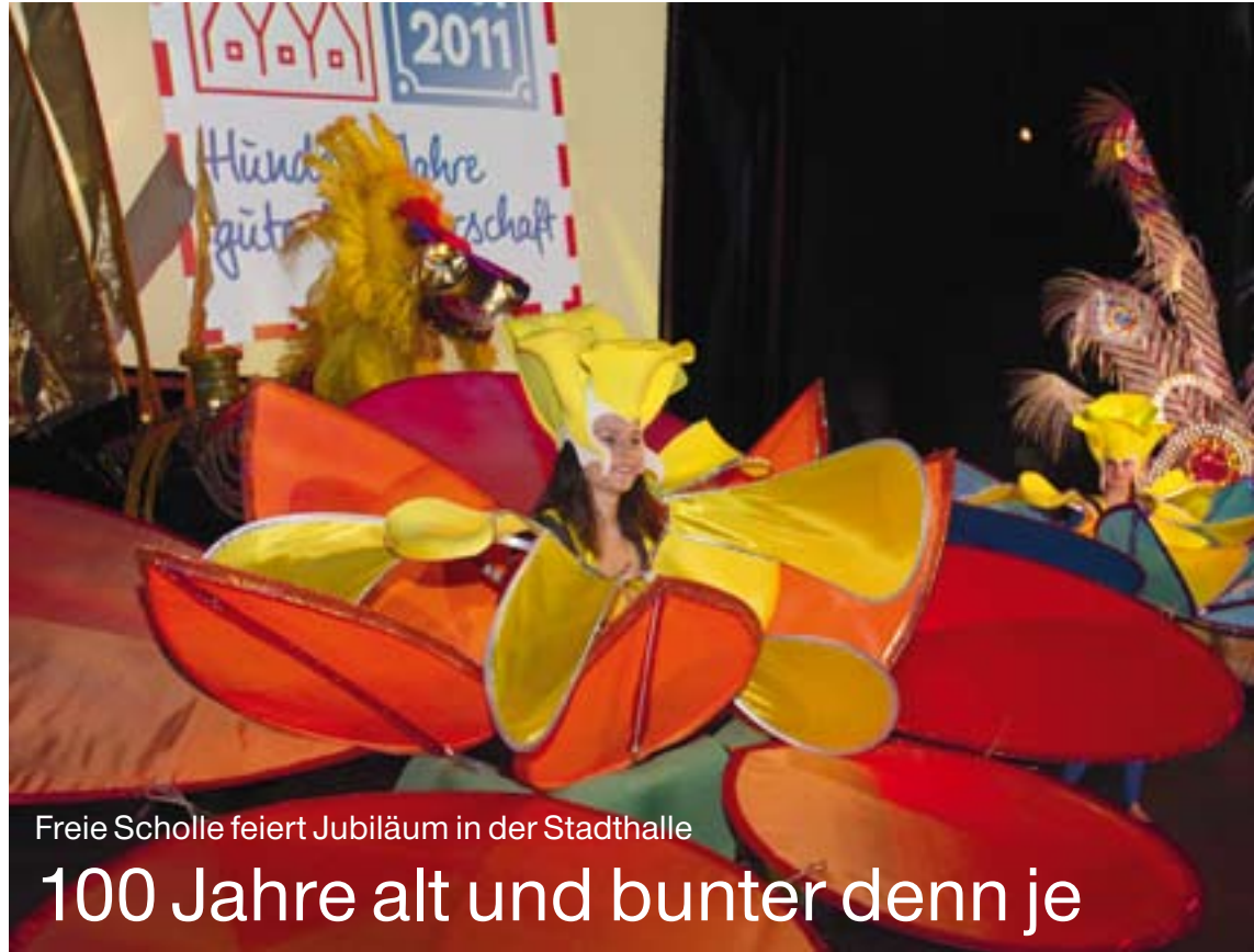
Freie Scholle feiert Jubiläum in der Stadthalle