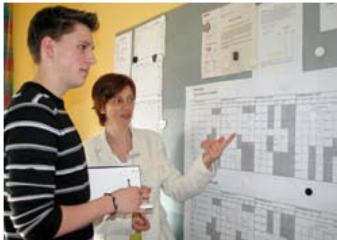
Tägliche Routine: Einsatzplanung im Mobilien Sozialen Dienst

Von Beginn an waren sie für viele alte Mitglieder eine wichtige Hilfe. Seit dem 1. Juli dieses Jahres muss der Verein Freie Scholle Nachbarschaftshilfe jedoch ohne die Zivis auskommen. An ihre Stelle treten »Freiwillige«. Dadurch kann der Verein sein Leistungsangebot aufrechterhalten.