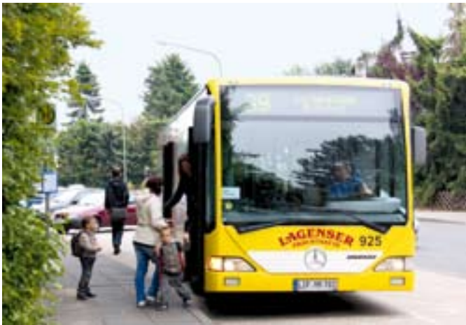
Hält jetzt direkt vor der Haustür: die Buslinie 39

Das Sennstädter Siedlungsgebiet Verler Dreieck ist jetzt noch besser ans Netz des Verkehrsunternehmens moBiel angebunden. Führen bislang Busse der Linie 37 ab den Haltestellen »Jochen-Klepper-Haus« und »Donauallee«, gibt es nun eine zusätzliche Linie, die direkt vor der Haustür an der neuen Haltestelle »Innstraße« hält.