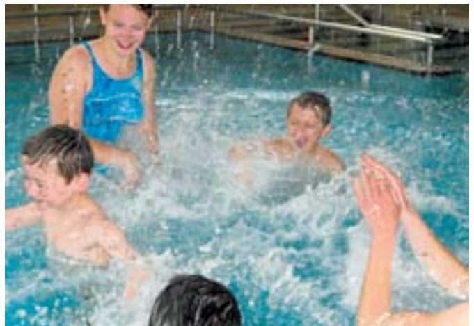
Im Wasser macht es mehr Spaß, wenn man schwimmen kann.

Die drei Mädchen und drei Jungen, die vorher keine oder doch nur wenig Erfahrung mit dem Element Wasser hatten, machten im Jabbok-Bewegungsbad in Bethel ihr Wasserfloh-Abzeichen. Sie können nun ganz beruhigt ihrer Einschulung nach den großen Ferien entgegen sehen und beim Thema Schwimmen mitreden.