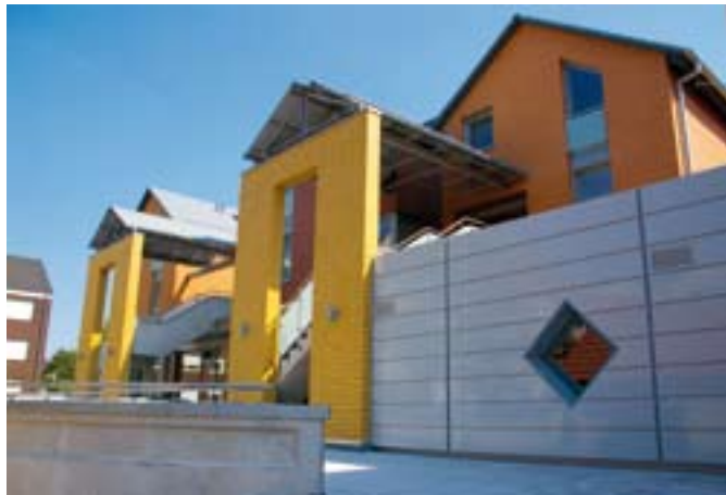
Spareinlagen der Mitglieder schaffen Wohnqualität.

G enossenschaften mit Spareinrichtung erhielten vom Gesamtverband der Wohnungs- und Immobilienwirtschaft die Mitteilung, die Bundesanstalt für Finanzdienstleistungsaufsicht (BaFin) sei der Auffassung, einige Genossenschaften verletzen das Regionalprinzip. Der Grundsatz, dass in einer Spareinrichtung das wohnende Mitglied sparen solle, werde zu wenig beachtet.