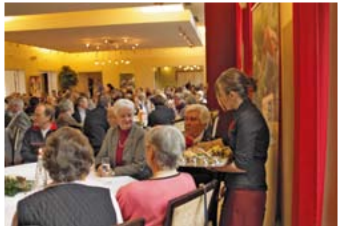
Die Ehrenamtlichen waren sich einig: Ein gelungener Auftakt!

Darüber hinaus sind die Ehrenamtlichen aber auch wichtige Multiplikatoren in der Ge-