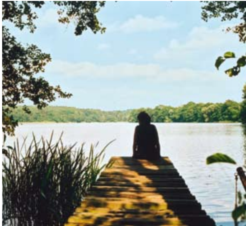
Wer jetzt über Treppenhausreinigung nachdenkt, hat keinen Urlaub.

In diesem Zusammenhang weist die Freie Scholle noch einmal auf ihre Aktion »Sicherheit durch Rauchmelder« hin. Von der Feuerwehr empfohlene Rauchmelder sind in der Verwaltung und bei den Serviceteams zum Preis von 2 Euro erhältlich.