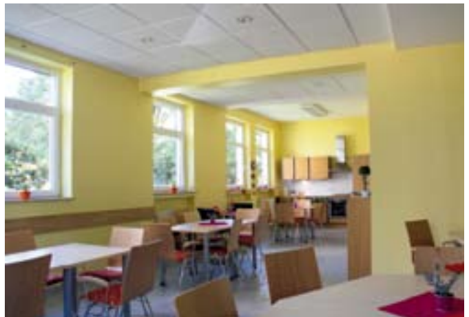
Mehr Platz für kommende Aktivitäten im Nachbarschaftstreff

Der Umbau wurde dadurch möglich, dass das Büro des Siedlungswartes aufgelöst und das Waschhaus verkleinert werden konnte. Dennoch bleiben alle Angebote des Waschhauses erhalten, so dass Waschmaschinen, Schleudern, Trockner und die Mangel auch künftig zur Verfügung stehen.