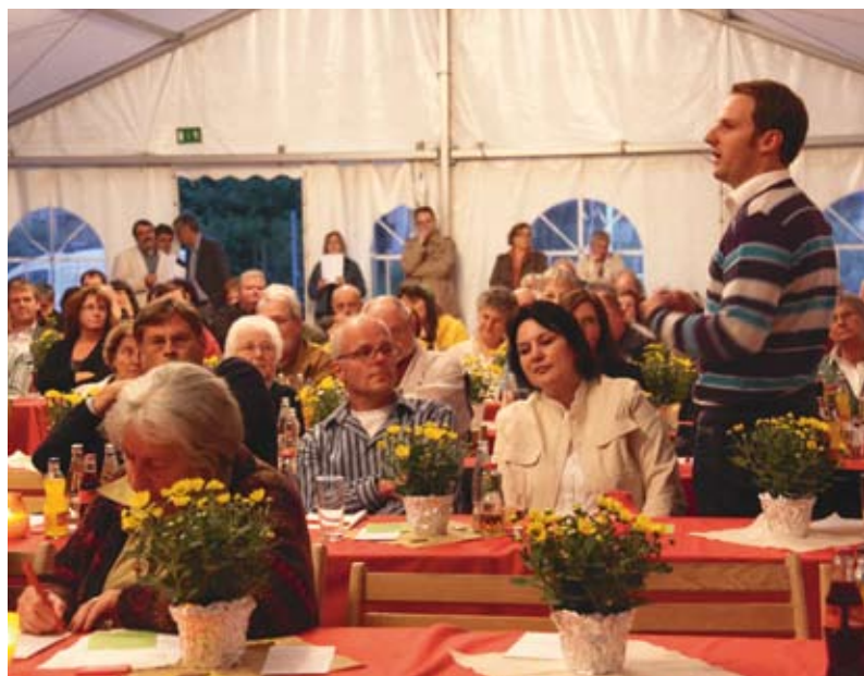
... bei der Vorstellung der Kandidaten