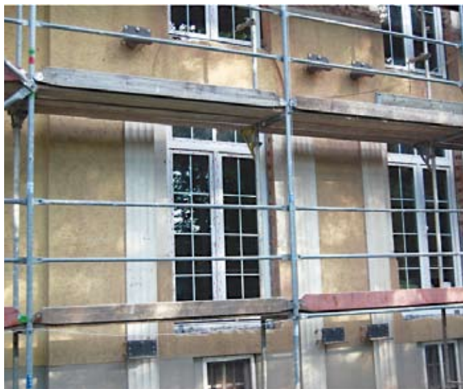
Trotz Wärmedämmung bleibt der Charakter der Fassade erhalten.

R und 8,5 Millionen Euro investierte die Freie Scholle in diesem Jahr in die Modernisierung ihres Hausbesitzes. Im Mittelpunkt standen dabei die energetische Nachrüstung sowie der barrierefreie Umbau des Woh-