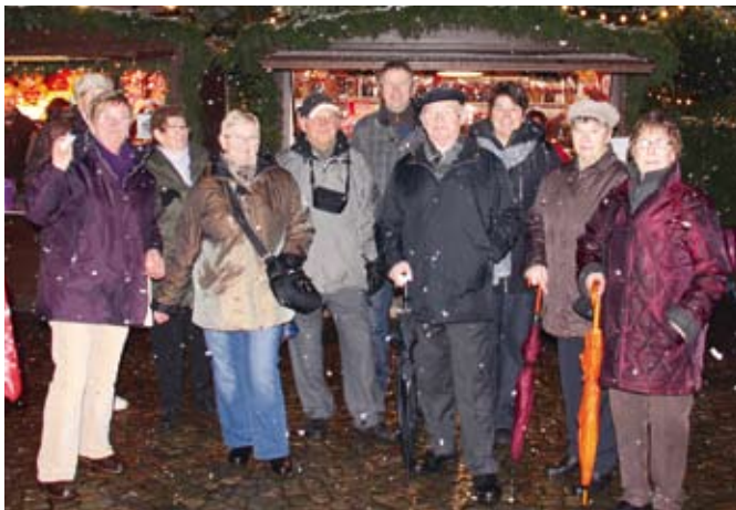
»Wir sehen uns gleich am Glühweinstand zum Aufwärmen.«