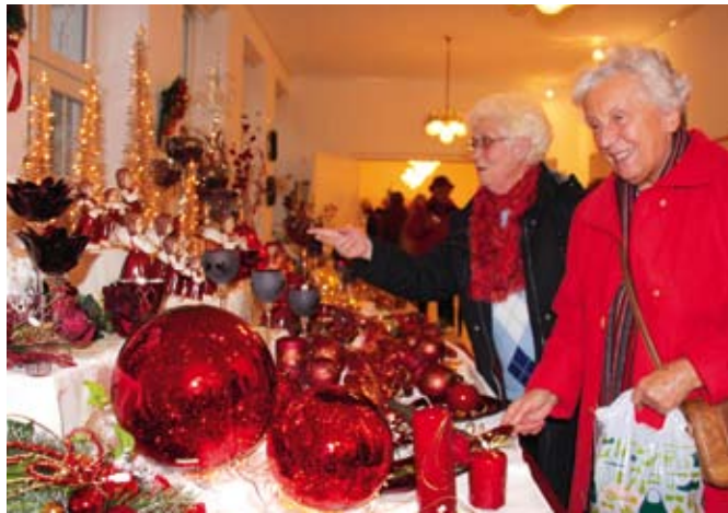
Vorweihnachtliche Augenweide für die Besucher aus Bielefeld

Während draußen bei typisch ostwestfälischem Schmuddelwetter keine richtige Adventsstimmung aufkommen wollte, stärkte sich die Besuchergruppe der Freien Scholle zunächst bei