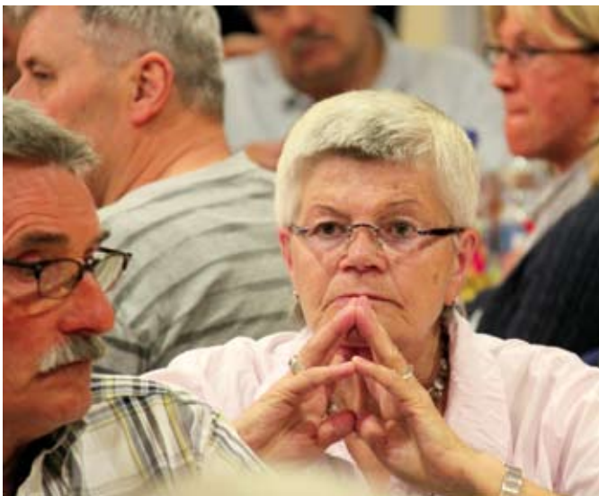
Aufmerksames Zuhören . . .

Zufrieden mit dem Verlauf der Wahlen zeigte sich auch der Wahlvorstand. Nach Abschluss der Vertreterwahlen stellte er die ordnungsgemäße Durchführung der Wahlen fest. Einsprüche und Beschwerden gegen das Wahlergebnis liegen nicht vor. Sie können bis spätestens 14 Tage nach Bekanntmachung des Wahlergebnisses in dieser Zeitung schriftlich an den Wahlvorstand gerichtet werden.