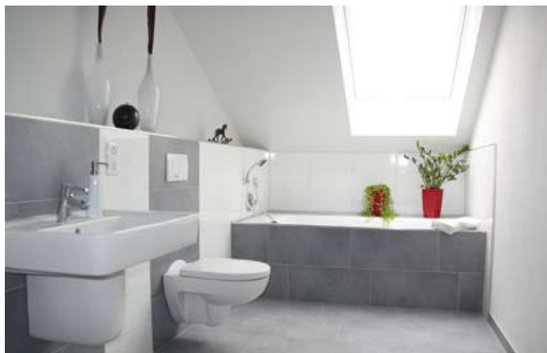
»Classic« wirkt tatsächlich so wie es heißt: klassisch.

Auf diese Weise entstehen absolut einzigartige und individuelle Wohlfühlorte, die ihren Bewohnern einen zusätzlichen Raum für mehr Lebensqualität bieten.