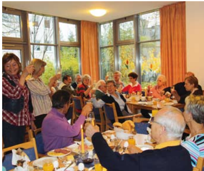
Ein Prosit auf die perfekten Gastgeberinnen

»Ich lasse keinen »Marktklön« ausfallen«, sagt eine Besucherin zufrieden über ihr Sektglas hinweg, das es anlässlich des einjährigen Bestehens des nachbarschaftlichen Frühstücks gibt. Sie und die anderen Gäste treffen sich hier jeden ersten Freitag im Monat um neun Uhr, um gemeinsam den Tag zu beginnen, ein schmackhaftes Frühstück für nur 3,50 Euro in netter und lustiger Runde einzunehmen und anschließend gestärkt zum Wochenmarkt zu gehen – ein richtiger »Marktklön« eben.