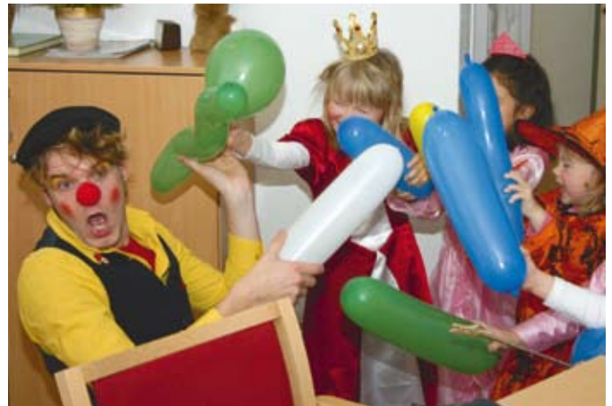
Früh übt sich, was ein guter Clown sein will.

Schon für die kleinen »Künstler« veranstalten die Theatermacher im nächsten Jahr ab Mitte Februar einen super Kurs, bei dem Tiere, Fabelwesen und Märchenge-