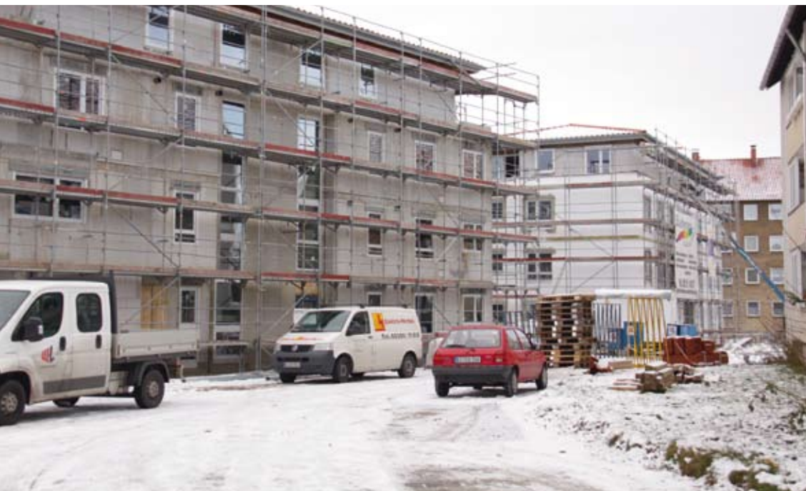
Spielt das Wetter mit, sollen die Neubauten an der Allensteiner Straße im April bzw. Juni 2011 bezugsfertig sein.

Gut voran kommen die Arbeiten für den Stadtumbau Allensteiner Straße. Dabei nehmen die Planungen für den Neubau an der Stieghorster Straße konkrete Formen an. Über den aktuellen Planungsstand können sich die Mitglieder im »Baubüro Stieghorst« informieren.