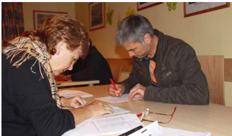
... erfolgen die Wahl und Auszählung der Stimmen.